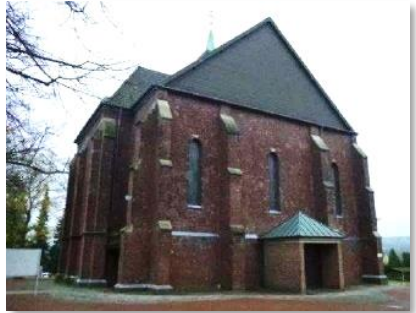
Monika Middeldorf - kfd Atsch-Mühle