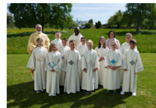
Unsere Erstkommunionkinder vom Sonntag, 26. April 2026

Mit grosser Freude durften wir am Sonntag, 26. April die Erstkommunion unserer Kinder aus der 3. Klasse feiern. Es war ein besonderer Moment für die Kinder, ihre Familien und unsere ganze Pfarrei. Ein herzliches Danke- schön an alle, die die Kinder auf diesem Weg begleitet und dieses Fest mitgestaltet haben. Sei es in der Vorbereitung, in der Liturgie, mit Musik, Gebet und Dasein. Ein Dank gilt auch den Eltern für ihre Unterstützung und Be- gleitung. Wir wünschen den Erstkommunion- kindern und ihren Familien, dass sie sich auf ihrem weiteren Glaubensweg von Gottes Nähe getragen wissen.