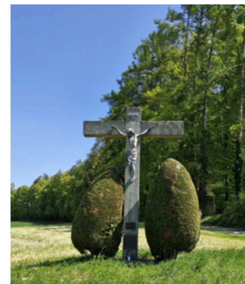
Wegkreuz Villmergen

Auch dieses Jahr laden wir Sie zu unseren Bittgängen vor Christi Himmelfahrt ein und erbitten speziell den Segen Gottes für unsere Fluren und Felder. Am Dienstag, 12. Mai versammeln wir uns um 18.30 Uhr beim Hof Keusch und gehen nach Hilfikon. Am Mittwoch, 13. Mai ist der Abmarsch ab Hof Keusch bereits um 18 Uhr, weil es nach Büttikon einiges weiter ist. Die Bittgänge finden nur bei gutem Wetter statt und werden jeweils um 17.30 Uhr mit dem Läuten der grossen Glocke unserer Pfarrkirche angekündigt. Bei schlechtem Wetter finden einfach die Gottesdienste in Hilfikon und Büttikon jeweils um 19 Uhr statt mit vorgängigem Rosenkranz um 18.30 Uhr. Der Gottesdienst am Mittwoch in Büttikon wird als Vorabendmesse zu Christi Himmelfahrt gefeiert.