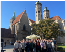
Gemeindefahrt nach Naumburg