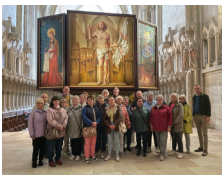
Der berühmte und umstrittene Altar