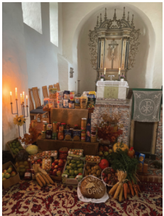
Erntedank in Ballersedt