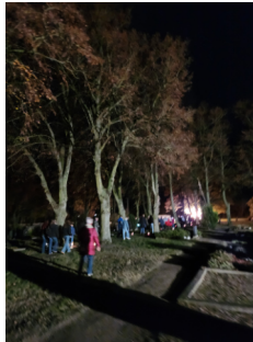
Martinstag in Osterburg