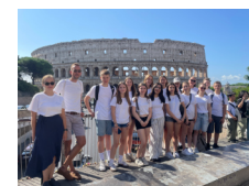
Junge Gemeinde in Rom