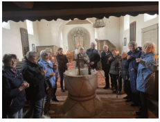
Erntedank in Ballersedt