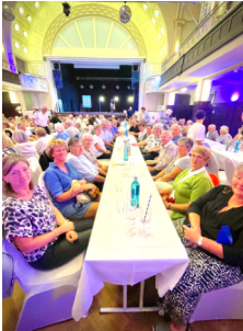
Ehrenamtsempfang in Stendal