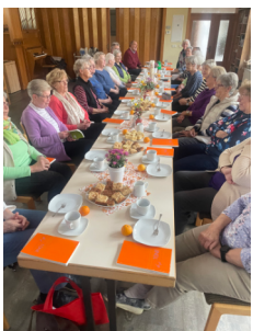
Gemeindenachmittag in Osterburg