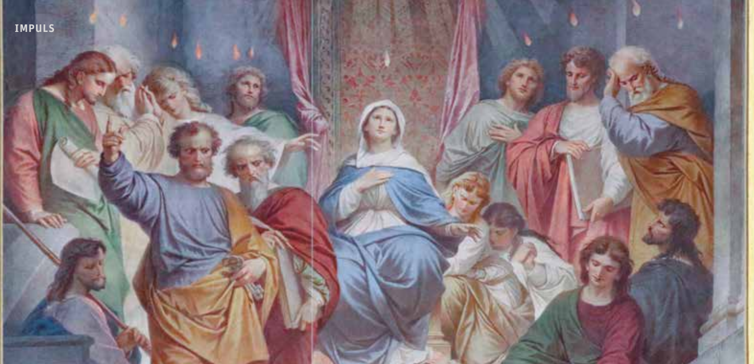
Altarbild der Jesuitenkirche, 1871 (Ausschnitt) | Foto: Peter Wegener