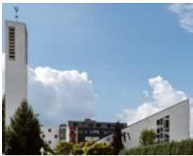
Christkönig Zum Hahnberg 10 34537 Bad Wildungen Reinhardshausen