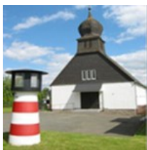
St. Bonifatius Semdenstr. 5 34513 Waldeck Sachsenhausen