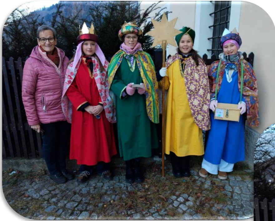
Sternsingergruppe: Waschinger und Burgwiese