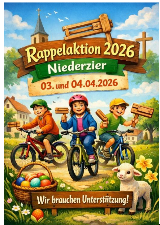
Bild: Mit Hilfe von KI erzeugt

Es wäre schön, wenn auch in diesem Jahr wieder die Kinder und Jugendlichen in jedem Haushalt freundlich aufgenommen und mit einer Spende belohnt würden. Die gesammelten Eier und Süßigkeiten werden untereinander aufgeteilt, das gesammelte Geld dient zur Unterstützung der jeweiligen Messdienerarbeit.