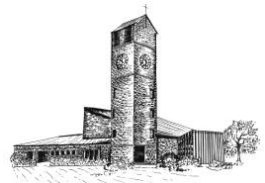
Verklärung Christi Rain