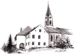
Mariä Himmelfahrt Atting