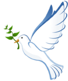
Abbildung nur in Druckversion.