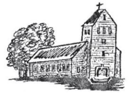
Hüven St. Bonifatius