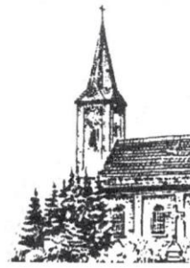
Stavern St. Michael