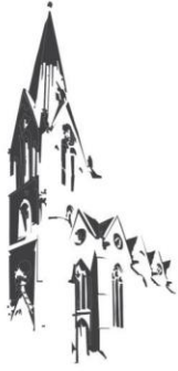
Sögel St. Jakobus