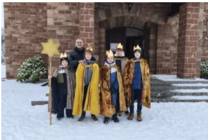
eine Gruppe in Alsbach