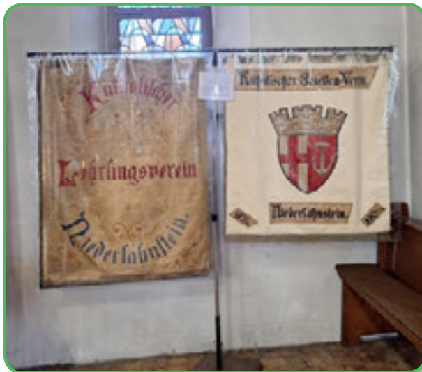
Die Vorderseiten der beiden Fahnen

Anfang 2024 wurden bei Aufräumarbeiten in Räumen der Barbarakirche, die nicht für jedermann zugänglich und deshalb nur selten besucht werden, Fahnen und Banner aus früheren Zeiten gefunden. Darunter auch zwei, die die Kolpingfamilie St. Barbara betreffen. Eine, die Fahne des Katholischen Gesellenvereins Niederlahnstein stammt aus dem Jahre 1906 und wurde zum 30-jährigen Jubiläum des später in Kolpingfamilie Lahnstein St. Barbara umbenannten Vereins gefertigt. Die andere vom Katholischen Lehrlingsverein Niederlahnstein dürfte noch älter sein. Obwohl beide in äußerst schlechtem Zustand waren, wurden sie von Fachleuten als wertvoll und erhaltenswert eingeschätzt, was die Kolpingfamilie bewog, sie nachfolgenden Generationen wieder zugänglich zu machen. Die erhaltenden Maßnahmen an beiden Fahnen wurden von einer renommierten Firma durchgeführt und sind mittlerweile abgeschlossen. Es hat sich gelohnt. Die Fahnen wurden bei der Mitgliederversammlung am 20. März erstmals im Gemeindehaus gezeigt und können jetzt in der Barbarakirche, in der Adolph Kolping – Seitennische bewundern werden.