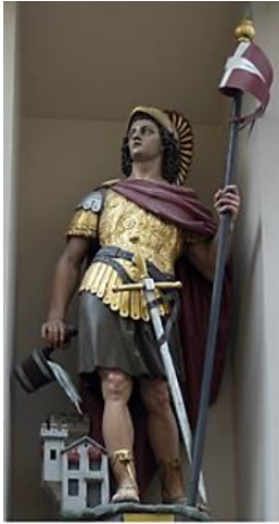
Hl. Florian Schutzpatron unserer Feuerwehrleute

DONNERSTAG Fest des hl. Georg 23.04. 9:00 Hl. Messe für die armen Seelen