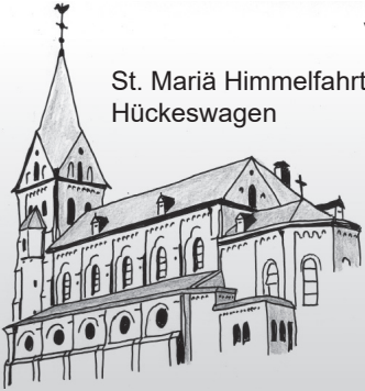
St. Mariä Himmelfahrt Hückeswagen