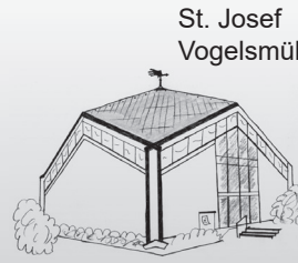
St. Josef Vogelsmühle