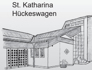
St. Katharina Hückeswagen