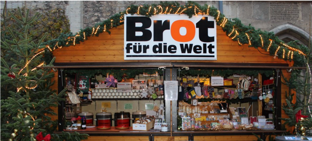
Am Montag, 08. Dezember, werden wieder Frauen aus unserer Kirchengemeinde den ganzen Tag den Stand „Brot für die Welt“ auf dem Braunschweiger Weihnachtsmarkt betreuen. Das Motto in diesem Jahr lautet: „Kraft zum Leben schöpfen!“