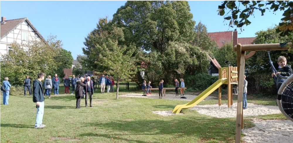
Unser neuer Spielplatz. Dank Ihrer Spenden konnte er zum Erntedankfest eingeweiht werden.