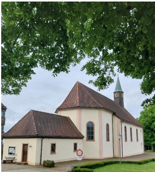
Wallfahrtskirche auf dem Lindenberg

Das Katholische Männerwerk der Kirchengemeinden Im Quellenland und Heilige Dreifaltigkeit lädt vom 30. Mai bis 6. Juni 2026 zur traditionellen Gebetswoche der Männer auf den Lindenberg bei St. Peter ein. Unter dem Leitwort „Woche der Eucharistischen Anbetung“ kommen Männer zusammen, um in Gebet und Vorträgen innezuhalten. Im Fokus stehen das Gebet für den Weltfrieden, die Kirche, unsere Familien sowie die großen Herausforderungen unserer Zeit.