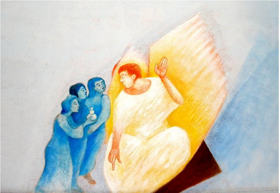
Foto: Friedbert Simon, Künstler: Polykarb Ühlein aus Pfarrbriefservice.de