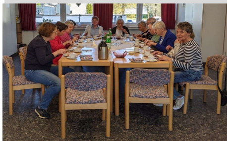
„Gemeinsam statt einsam“ im Pfarrzentrum Kirchhundem am 26. April