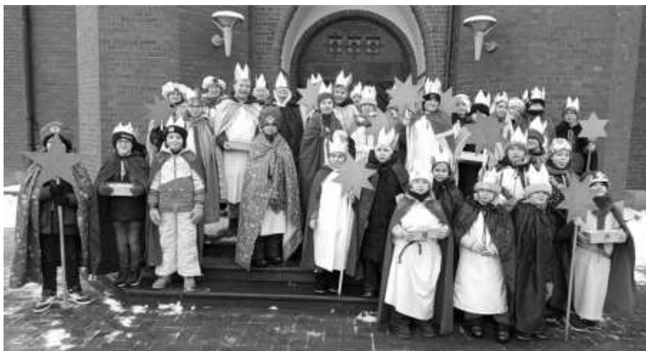
St. Aloysius, Nortrup

Ein herzliches Dankeschön allen Spender:innen und allen, die zum Gelingen der diesjährigen Sternsingeraktion beigetragen haben!!!