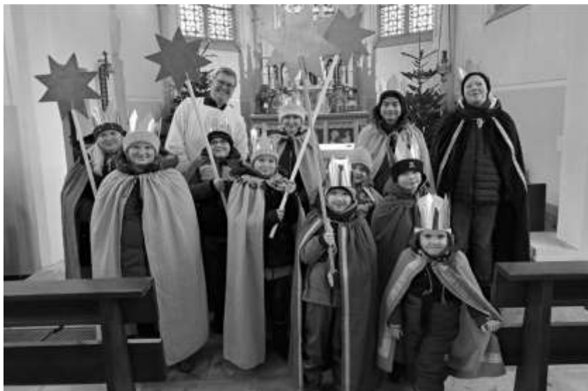
St. Marien, Badbergen