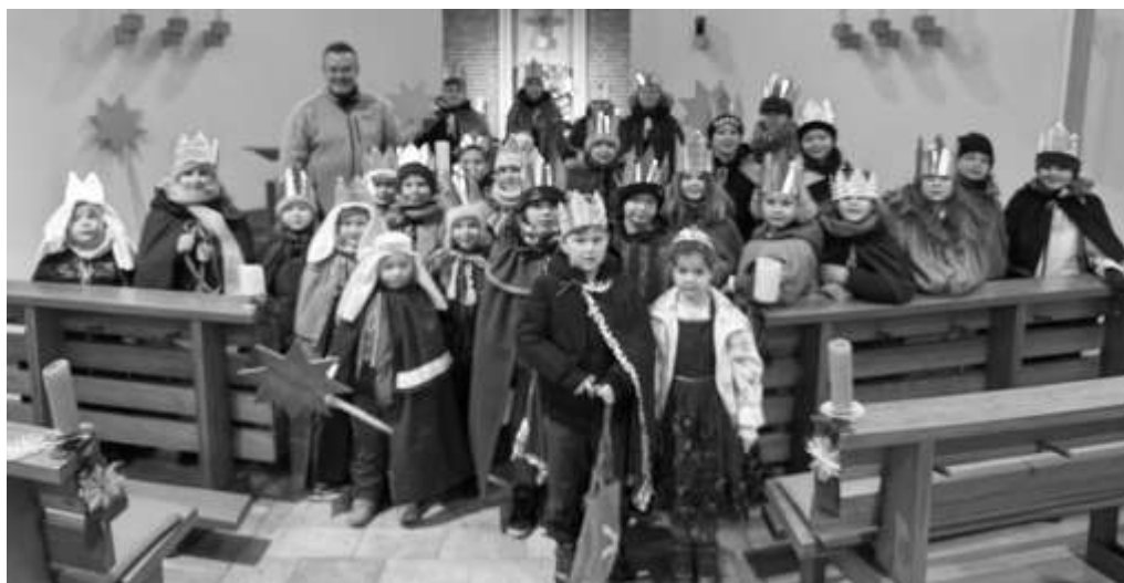
St. Marien, Quakenbrück/St. Paulus, Hengelage