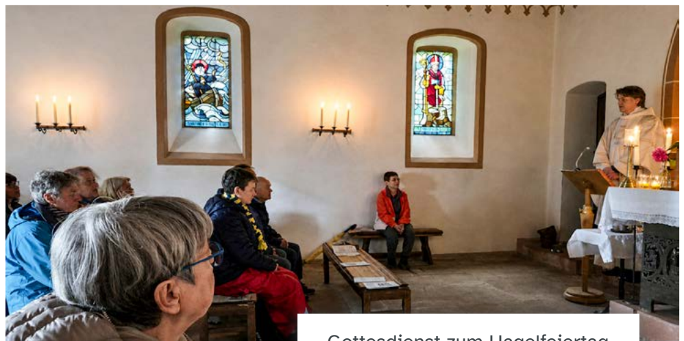
Gottesdienst zum Hagelfeiertag in der Walburgiskapelle