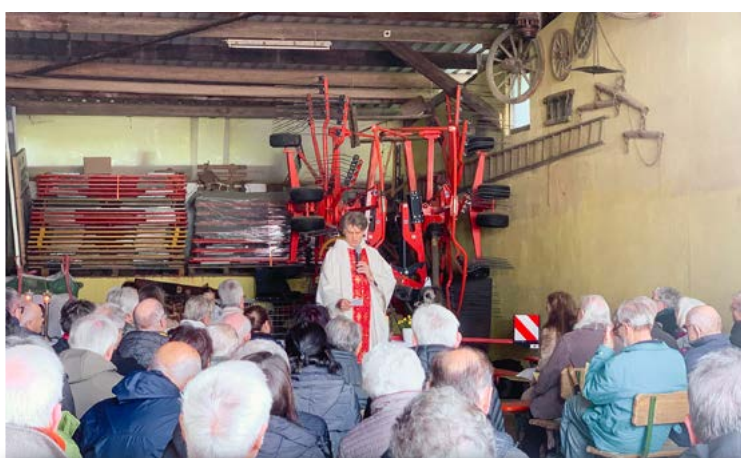
Prozession und Gottesdienst an Christi Himmelfahrt auf dem Langklinger Hof