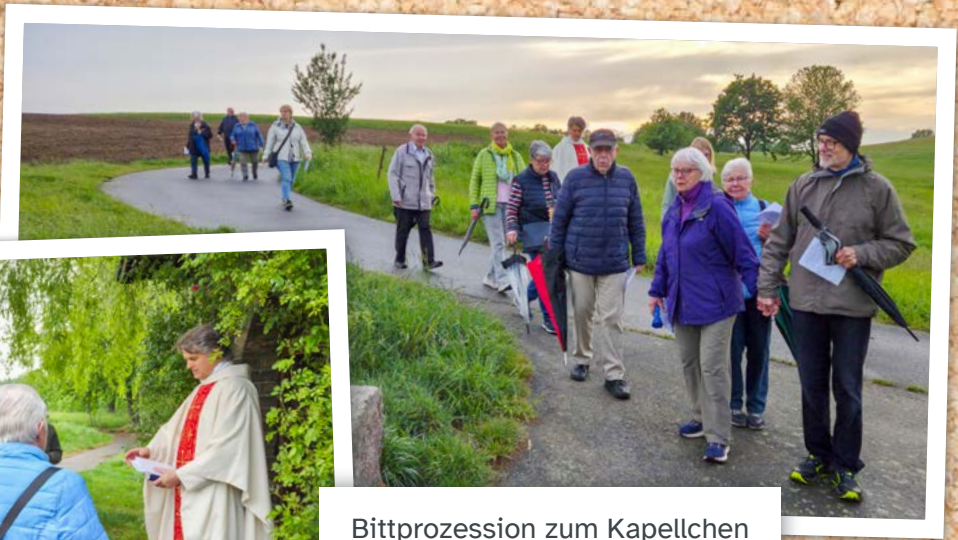
Bittprozession zum Kapellchen in Mörlenbach