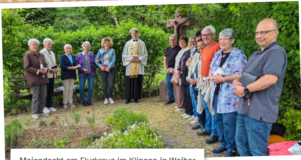
Maiandacht am Flurkreuz im Klingen in Weiher