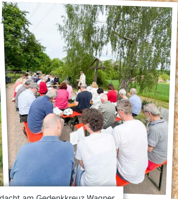
Kolping-Maiandacht am Gedenkkreuz Wagner