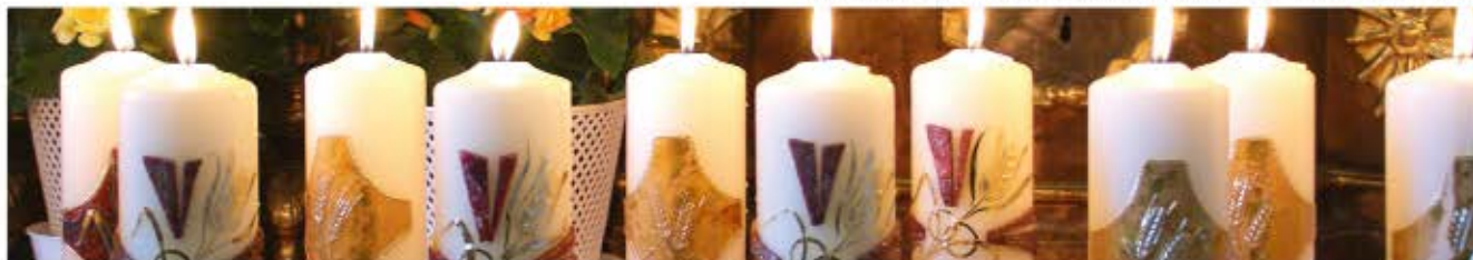
Bild: Martin Manigatterer (Foto)/Sr. Marianna (Kerzen) - In: Pfarrbriefservice.de

Paare, die eine Gratulation wünschen, melden sich bitte im Pfarrbüro.