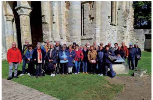
Das Bild zeigt die Reisegruppe in der Ruine der Abtei von Jumièges. Sie geht auf eine karolingische Gründung im Jahre 654 zurück.

Unser erstes Hotel war in Rouen, der Stadt, in der Johanna von Orleans auf dem Scheiterhaufen verbrannt wurde. Einer Vision gehorchend stand sie im 100-jährigen Krieg zwischen Frankreich und England dem noch sehr jungen französischen König zur Seite. Als Johanna dann im Rahmen Anklage durch die Inquisition die Hilfe des Königs gebraucht hätte, blieb dieser stumm. Später wurde die Jungfrau von Orleans kirchlich rehabilitiert und heiliggesprochen. Beim Ort ihrer Hinrichtung steht heute eine schöne, moderne Kirche.