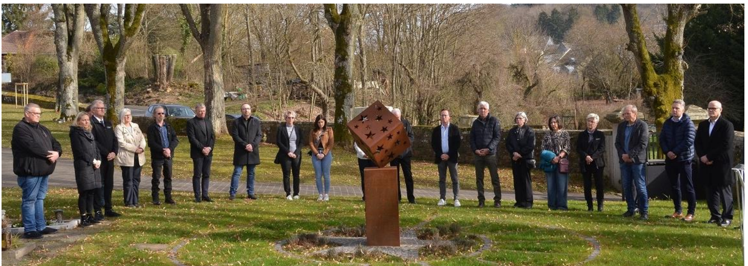
(Text: Rudolf Esser)

Und als Christ möchte ich darauf hinweisen und betonen, dass niemand die Würde des Menschen besser beurteilen kann als Gott unser Schöpfer, der uns nach seinem Bild geschaffen hat.