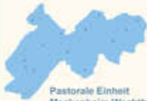
Pastorale Einheit Meckenheim-Wachtberg