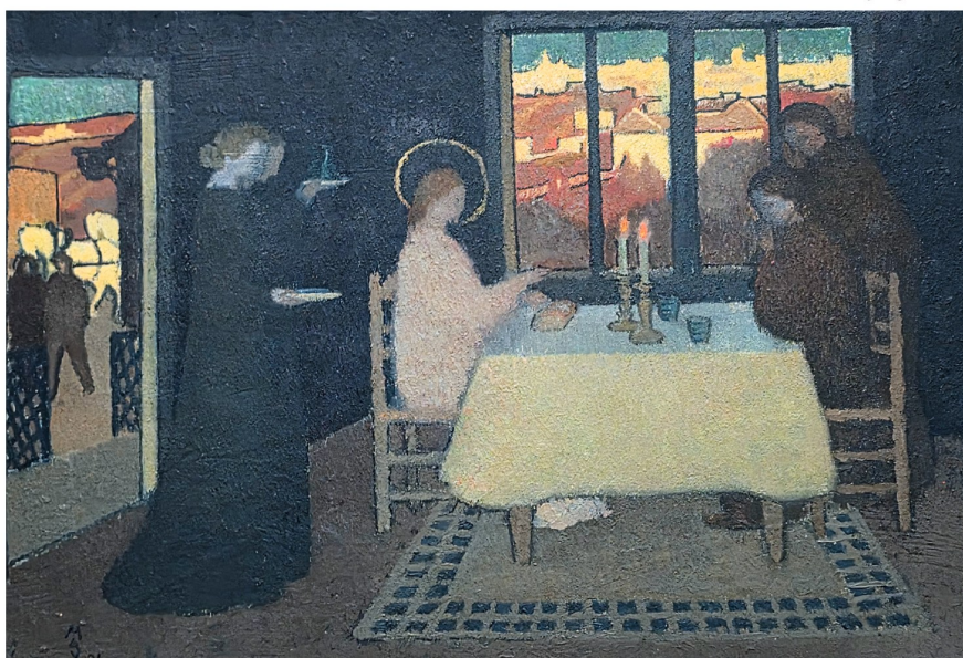
Maurice Denis, Die Emmausjünger, 1894

In Emmaus merken die Jünger: Sie waren und sind nicht allein, zu keiner Zeit. In der ganz realen Geste der Nächstenliebe, des Brotbrechens Jesu, realisieren sie: Er, Jesus Christus, ist da, lebendig. Ostern – da geht noch was! Es geht weiter für uns, trotz allem Leid, aller Trauer, allen Ängsten, trotz unserer Verzweiflung.