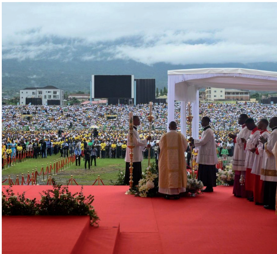
Podle místních zdrojů se bohoslužby účastní 35 tisíc lidí