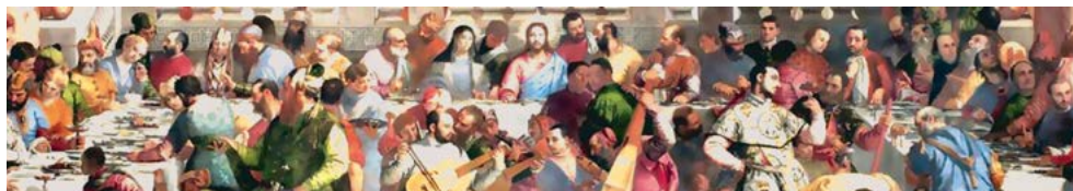
Bildausschnitt: „Die Hochzeit zu Kana“ von Paolo Caliari