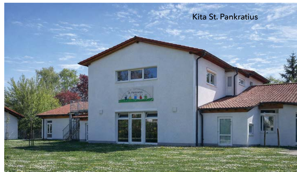
Kita St. Pankratius