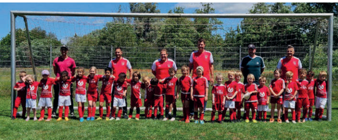
Strahlende Gesichter bei allen Beteiligten