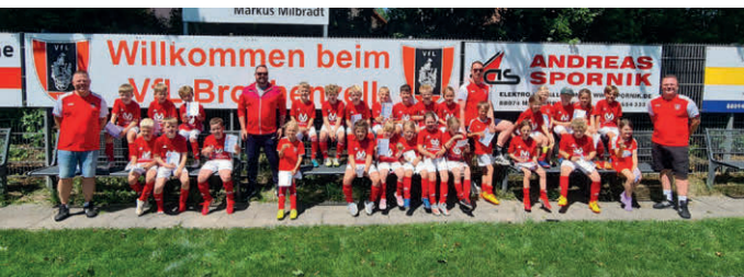
Ein erfolgreiches Turnier für die F-Jugend des VfL Brochzell