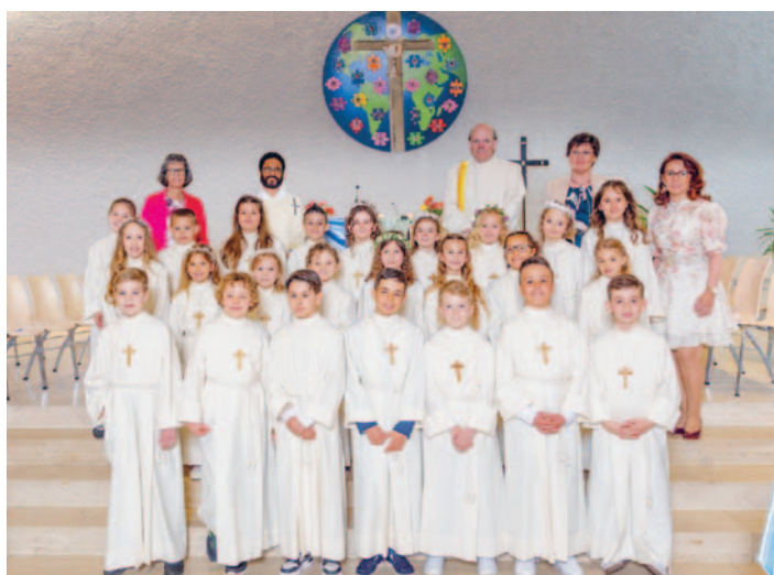
HI. Erstkommunion in Sulgen am 19. April