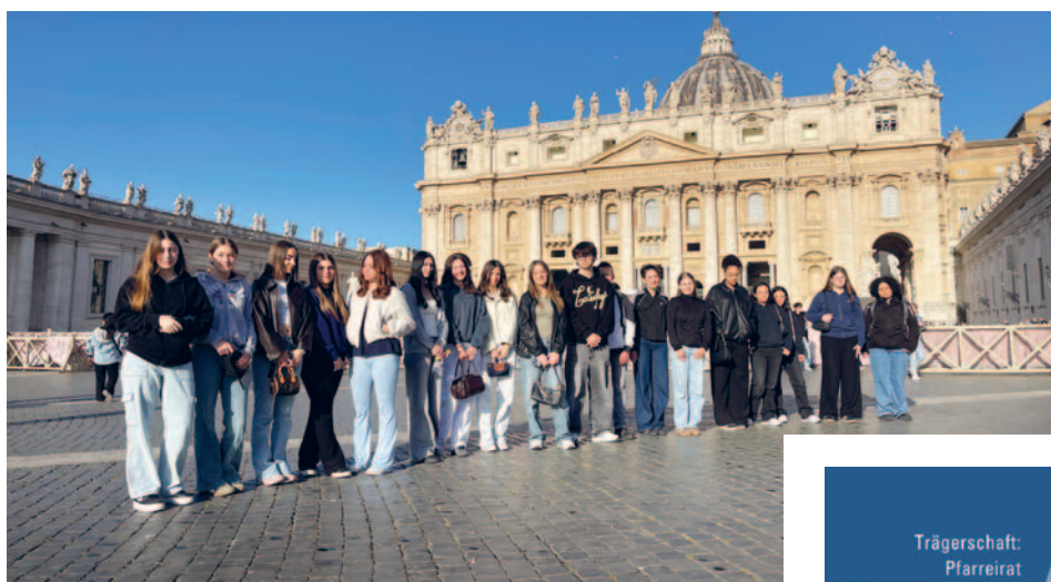
Die Sulgener Firmgruppe vor dem Petersdom in Rom