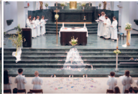
«Du gehst mit!»