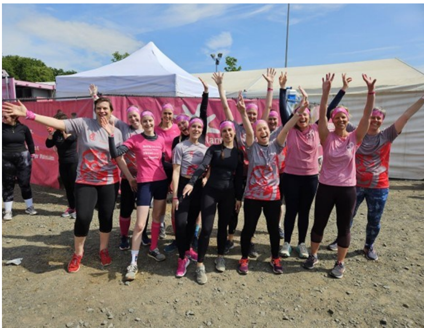
© Daniela Angermann / Bild aus 2025