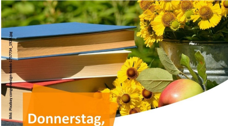
design-books-1757734_1927.jpg