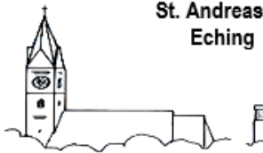
St. Andreas Eching