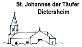
St. Johannes der Täufer Dietersheim