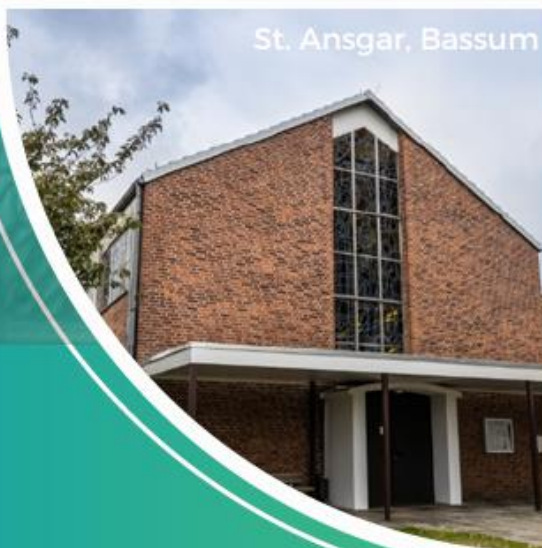
St. Ansgar, Bassum