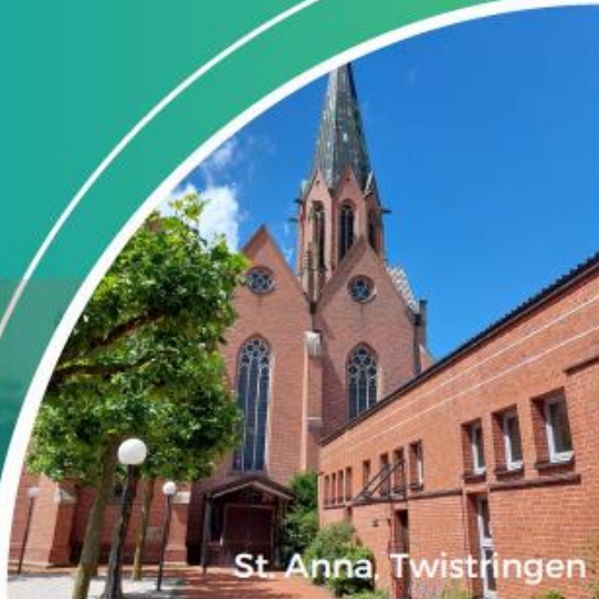
St. Anna, Twistringen