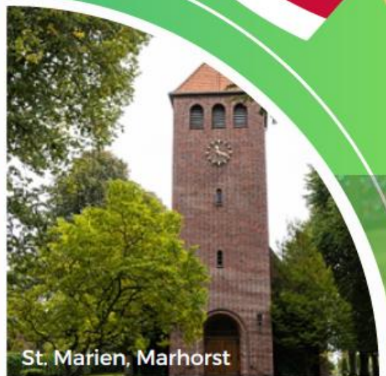
St. Marien, Marhorst