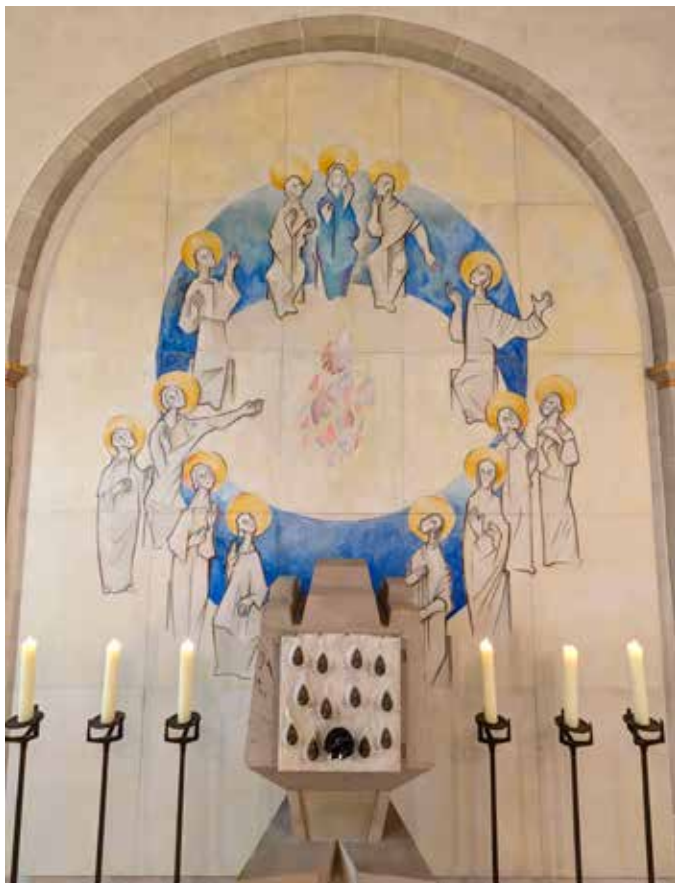
St. Martinus Dünschede

für 3 Wochen! Gottesdienste vom 07.06. – 28.06.2026 • Nr. 7 / Sonntag, 07.06.2026