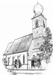
St. Andreas (St.A.)