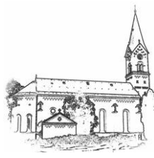
St. Nikolaus (St.N.)