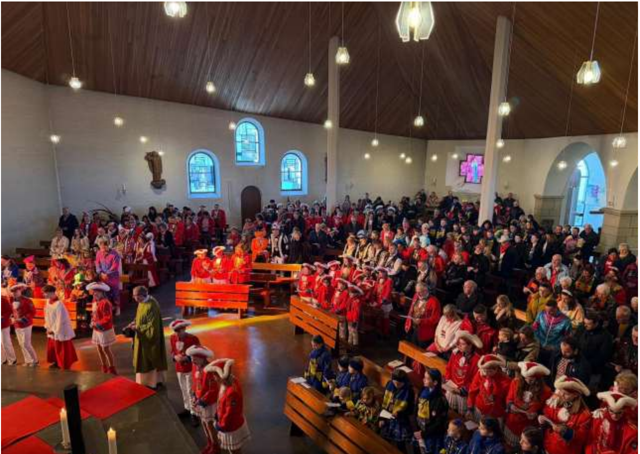
Die gut gefüllte Kirche am Karnevalssonntag in Niederzissen