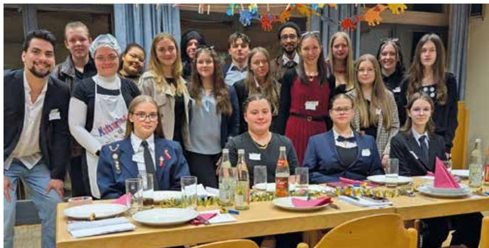
Text und Foto: Celina Saumweber

Vielen Dank an ALLE fürs mitmachen & für die tolle Vorbereitung!