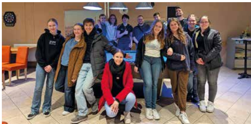
Text und Fotos: Celina Saumweber