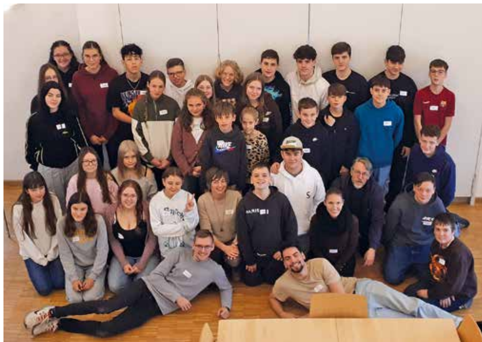
Text und Foto: Celina Saumweber

Gestärkt vom Mittagessen ging es nochmal eine letzte Runde in den Kleingruppen weiter bis wir uns dann alle gemeinsam im großen Saal getroffen haben. Hier gab es noch einen kleinen Werbe-Block von unserem Dekanatsjugendreferenten Diakon Max Sperber für die evangelische Jugend und unsere Jugendgruppe „Burghausen“. Auch bestand die Möglichkeit unsere Teamer kennen zu lernen. Zum Abschluss des Tages gab es noch einen kleinen Gottesdienst. Ein schöner Tag mit vielen verschiedenen Gesichtern aus unserer Region