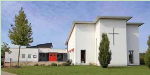
Gemeindezentrum Philipp-Melanchthon-Haus Jettingen-Scheppach