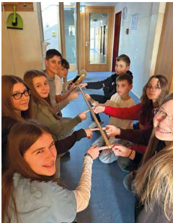
Text und Foto: Celina Saumweber

Währenddessen haben sich unsere Teamer mit Jugenddiakon Max Sperber mit der Jahreslosung 2026 beschäftigt.