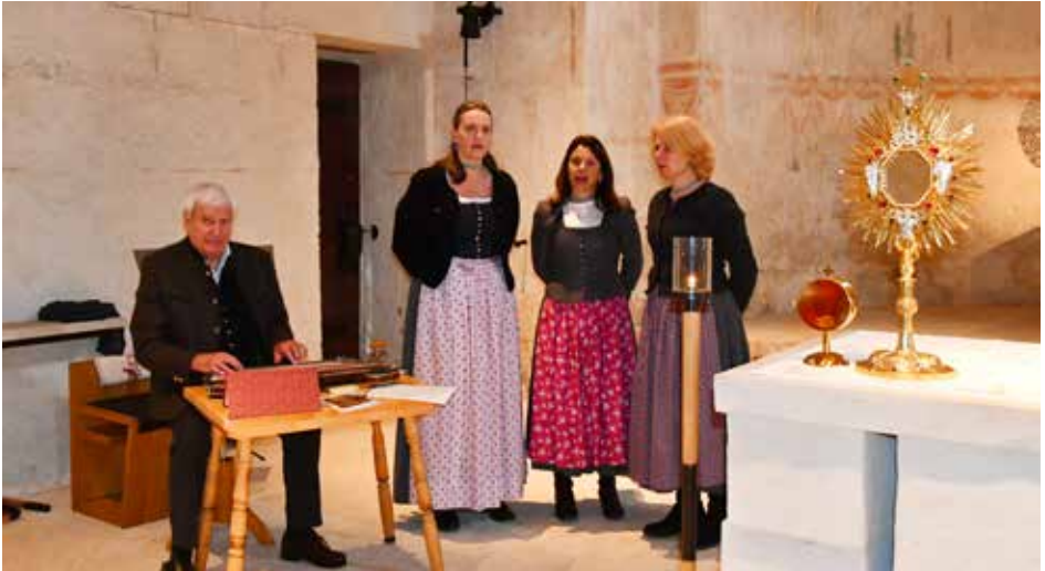
Grasbrunner Dreigsang

Am 22. März 2026 um 17 Uhr findet in der Kirche St. Aegidius in Keferloh eine Andacht zum Passionssonntag statt. Sie wird mit volksmusikalischen Klängen begleitet. Der Ottobrunner Viergsang und der Grasbrunner Dreigsang bringen Lieder zu Gehör, die den in Bayern tief verwurzelten Glauben zum Ausdruck bringen. Abgerundet wird die Andacht mit schönen Klängen des Niederhamer Saitenklangs sowie Texten und Gebeten von Pfarrvikar Stefan Berkmüller.