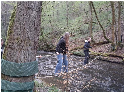
Hier durften wir unsere Balance beim Adventure-Trail trainieren.

Nach einer langen Anreise, mit ein paar Stunden im Stau stehen, kamen wir am späten Abend bei der Klostermühle in Obernhof an. Die Zeit in der Klostermühle war wieder geprägt von einem tollen bunten Programm, in dem die Teens Gott durch die Lebensberichte der Mitarbeiter vor Ort und durch die Andachten erleben konnten. In diesem Jahr konnten wir auch wieder auf der Lahn Kanu fahren, da sowohl das Wetter als auch der Wasserstand perfekt dafür waren.