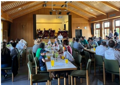
Fronleichnamsprozession in Letzau mit anssl. Frühschoppen im Gemeindehaus