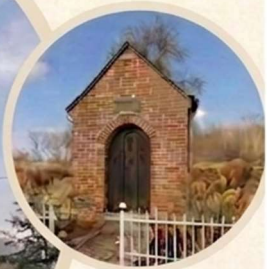
Sessenhausen So 28.06.2026, 17 Uhr