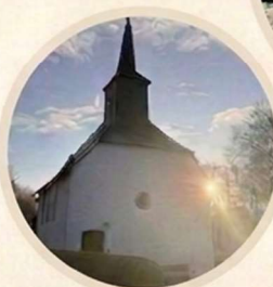
Oberherschbach So 29.11.2026 • 14.00 Uhr

Treffpunkt: Kapelle in Karnhöfen / Karnhöfener Straße