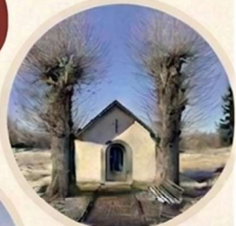
Krümmel Sa 03.10.2026 • 18.00 Uhr