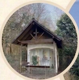
Marienrachdorf Mi 01.04.2026 • 15.00 Uhr