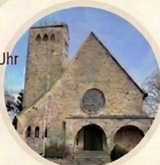
Kuhnhöfen Di 08.09.2026 • 18.00 Uhr