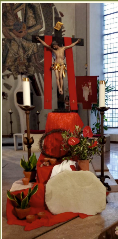
Osterkreuz St. Mauritius, Alsweiler

Was sucht ihr den Lebenden bei den Toten? Er ist nicht hier, er ist auferstanden. (Lukas 24,5-6)