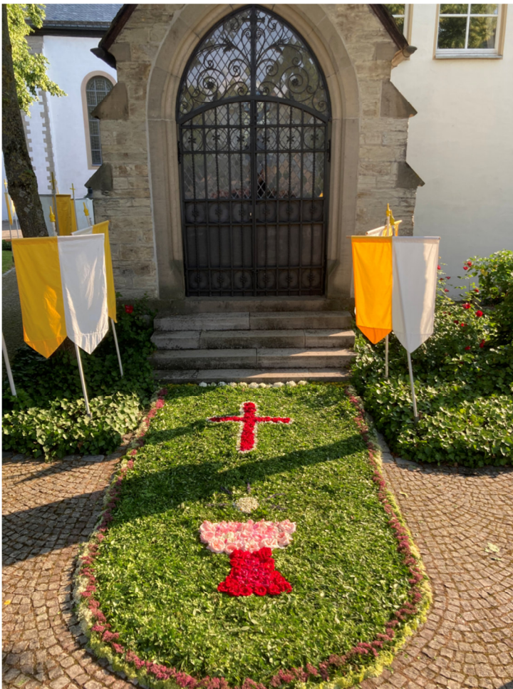
Bild: Pastoraler Raum Wünnenberg – Lichtenau Stationsaltar an der Antoniuskapelle Atteln

Wir beten, dass der Sport ein Instrument des Friedens, der Begegnung und des Dialogs unter den Kulturen und Nationen sei und die Werte wie Respekt, Solidarität und persönliches Wachstum fördere.