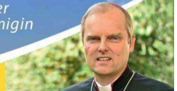
Weihbischof Florian Wörner / Bistum Augsburg