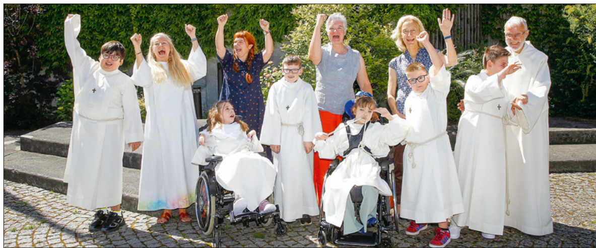
Freude und Jubel nach der Erstkommunion bei den Erstkommunionkindern und den Religionslehrpersonen.

Am 13. Juni feierten sechs Kinder der Stiftung Rodtegg und der Heilpädagogischen Schule Luzern ihre Erstkommunion zum Thema «Jesus – Brot des Lebens». Bei prächtigem Wetter strahlten die Kinder mit der Sonne um die Wette.