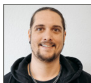
Michel Kölliker.

Wir heissen alle drei herzlich willkommen und wünschen ihnen einen guten Start, viel Freude und Gottes Segen für ihre Aufgaben in unserer Pfarrei.