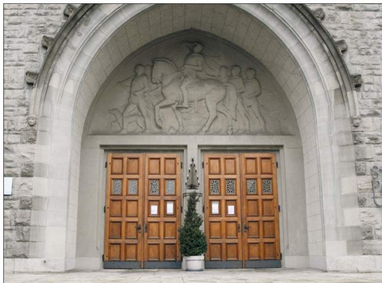
Hauptportal der Pauluskirche mit Paulus.