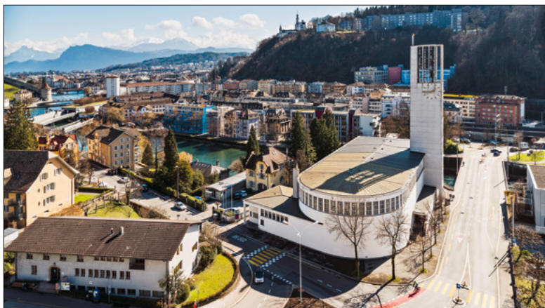
Blick vom Schulhaus ins Quartier.

Zahlreiche Vereine und Gruppierungen beleben und bereichern das St.-Karli-Quartier. Hier wird spürbar, wie Theorie und Praxis Hand in Hand gehen.