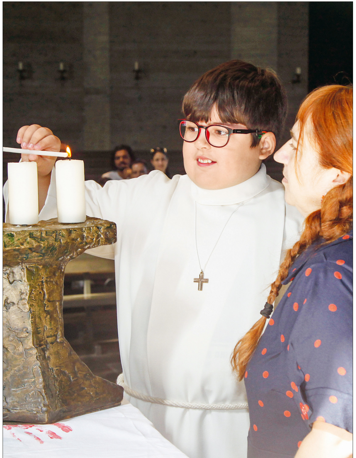
Ein Erstkommunikant entzündet auf dem Altar die Kerzen.