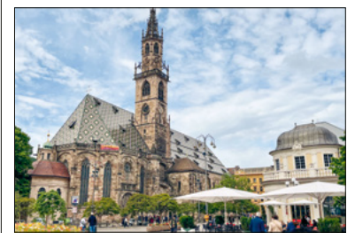
Dom in Bozen.

Einen ausführlichen Bericht und Fotos sehen Sie auf der Homepage unter: Pfarreireise St. Anton · St. Michael ins Südtirol.