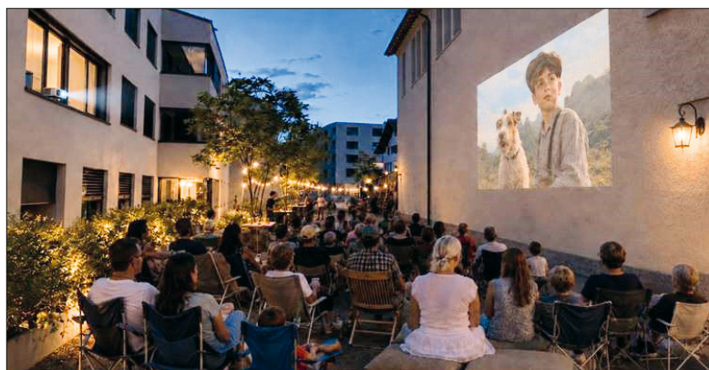
Wenn die Kirchenwand zur Kinoleinwand wird.

Passend zum Vorabend des Nationalfeiertags laden wir zu einem gemütlichen Sommerabend mit zwei aktuellen Schweizer Filmen unter freiem Himmel ein.