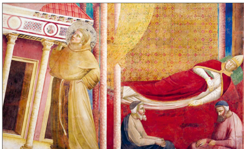
Papst Innozenz III. träumt, wie Franziskus die vom Verfall bedrohte Kirche stützt.