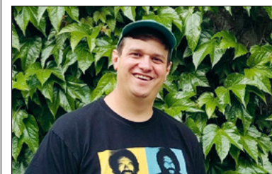
Peter Egli.

In der Spielgruppe in der Büttenenhalde hat es noch freie Plätze. Gemeinsam spielen, singen, basteln, erste Erfahrungen in der Gruppe sammeln. Für Kinder ab 2½ Jahren, Start Ende August. Information und Anmeldung unter: spiel-gruppe.ch oder 077 468 23 18