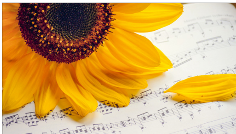
Sommerfeeling und Musik.

Besondere Klänge, sommerliche Atmosphäre und inspirierende Gottesdienste während der Sommerferien in der Johanneskirche Luzern.