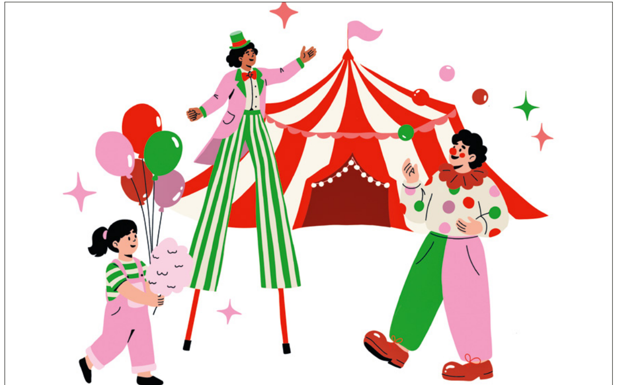
Staunen und Feiern im Zirkus. Grafik: Katholische Kirche Stadt Luzern