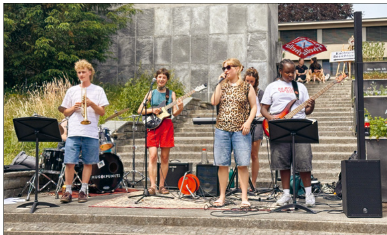
Die Seppelband sorgte für eine gute Stimmung.

Das Maifest verbindet Generationen und macht den Maihof zu einem Ort der Begegnungen.