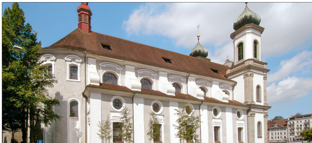
Seitenansicht der Jesuitenkirche ohne den hölzernen Pavillon, auch «Theaterbox» genannt (2013).

Hochschuleseelsorge: unilu.ch/horizonte Fabian Pfaff, Hochschuleseelsorger