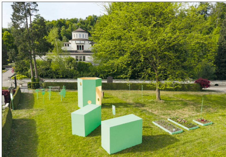
Schautafeln im Friedhof erläutern Bräuche und Rituale rund um die Bestattung (im Hintergrund das alte Krematorium). Foto: E. Ammon/Stiftung Feuerbestattung (2026)

So erfahren Besucher:innen gleich beim Eingang des Friedhofs, dass «Andersgläubige» erstmals 1782 eine letzte Ruhestätte auf dem Friedhof des damaligen Bürgerspitals fanden. Als 1885 der städtische Friedhof Friedental eröffnet wurde, war es Katholik:innen noch nicht erlaubt, sich kremieren zu lassen. Gleichwohl wurde eine Parzelle für den Bau eines Krematoriums freigelassen, denn 1876 war in Mailand das erste Krematorium Europas eröffnet worden, 1886 folgte in Zürich das erste in der Schweiz. Erst 40 Jahre später wurde das Luzerner