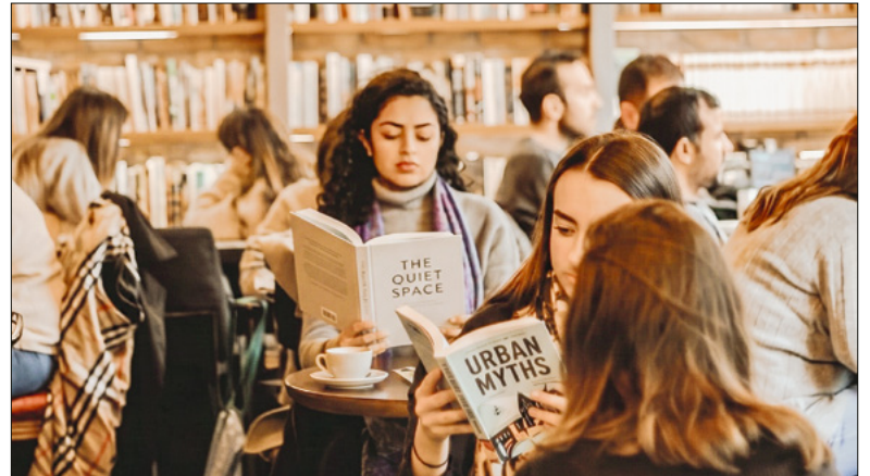
Lesen – jed:r für sich und doch gemeinsam.

Ein Buch, Ruhe, Gemeinschaft – und Raum für dich. Kein Telefon, kein Smalltalk, kein Pflichtprogramm. Einfach hinsetzen, Buch aufschlagen, weg sein: Das ist die «Silent Reading Hour – gemeinsam einsam lesen» in der Peterskapelle. Wenn die Sommerhitze draussen flimmert und der Alltag laut ist, laden wir zu einem besonderen Sommermoment ein: ein stiller und doch gemeinschaftlicher Leseanlass in gemütlicher, kühler und sakraler Atmosphäre in der Peterskapelle. Alle bringen ihre eigene Lektüre mit oder stöbern in den bereitgestellten Büchern, und wir machen es uns auf Kissen bequem, auf Stühlen oder Bänken. Wir lesen gemeinsam und doch jeder für sich. Ohne Programmstress oder Leistungsdruck, einfach still, entspannt, für sich und doch untereinander verbun-