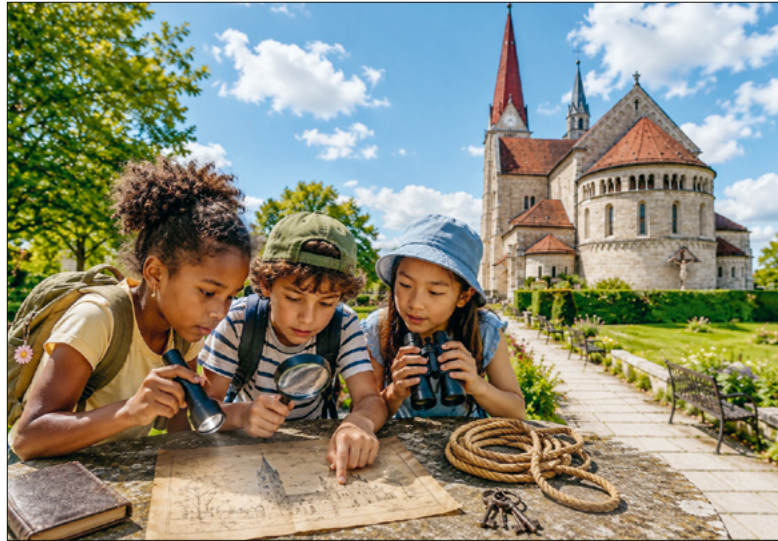
Auf Spurensuche. Foto: Ruza Jurisic (mit KI generiert)

Rätseln, entdecken und kreativ sein. Unsere Pfarrei macht beim Ferienpass mit und freut sich auf dieses neue Abenteuer.