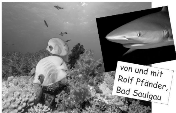
von und mit Rolf Pfänder, Bad Saulgau

Eine magische Grenze überzieht fast Dreiviertel der Oberfläche unserer Erde, eine Grenze, die nur von wenigen Lebewesen unbeschadet überschritten werden kann: die Wasseroberfläche. Das Leben darunter gibt es in den vielfältigsten Formen, in Seen, Flüssen und Meeren. Der Bildvortrag von Rolf Pfänder entführt den Zuschauer in diese verborgene und den meisten Menschen unbekannte Welt. Zu sehen sind an diesem Abend die schönsten Bilder aus über 40 Jahren Unterwasserfotografie. Er taucht und fotografiert im Salz- und Süßwasser, deshalb sind auch Fotos aus den heimischen Gewässern zu sehen. Die meisten Bilder sind jedoch im Meer und vor allem in den Korallenriffen entstanden, also eine große Bandbreite, vom Hecht bis zum 30 Tonnen schweren Wal.